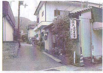
加茂郷商店街にあるお店

地球温暖化要因である二酸化炭素(CO2)の排出量の増加に伴い、環境省では、平成20年度事業のひとつとして「エコポイント」等CO2削減のための環境行動促進事業」を計画しました。 これをうけて、エコポイントの活用によるグリーン家電普及促進事業を実施します。具体的には、①CO2の削減。②経済の活性化。③地上デジタル放送対応テレビへの切り替え加速に向けて、省エネ効果の高い家電(統一省エネラベル4つ星相当 以上のエアコン、冷蔵庫、地上デジタル放送対応テレビ)購入に対し、エコポイントを取得できるようにし、様々な商品に交換できるようにする事業です。 エコポイントと交換できる様々な商品及びその提供事業者等について、登録・商品交換申請手続きが必要になります。 お問い合わせ ●グリーン家電エコポイント 対応窓口 0570(063) 800 ●書類作成等のご相談は、商工会事務局へお申し出下さい。